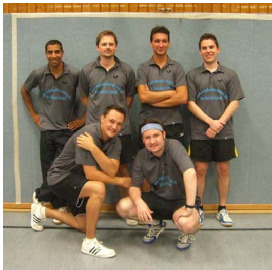
Die 1. Mannschaft